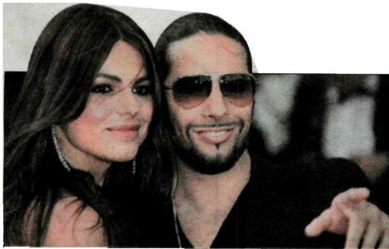
La top model Marisa Jara et Joaquín Cortés sont ensemble depuis le mois d'avril. Ils ont rendu leur relation officielle au Festival de Cannes