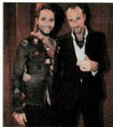
Compatriotes, Joaquín Cortés et Carlos Leal ont fait connaissance au Bal de la Croix-Rouge.

à ses côtés une belle histoire et ce malgré les distances et leurs agendas respectivement surchargés. «On se voit peu, et parfois il nous arrive de nous demander si nous ne sommes pas entrain de prendre de la distance. Les relations humaines sont un peu compliquées. Mais si le feeling passe, c'est le plus important!» ■