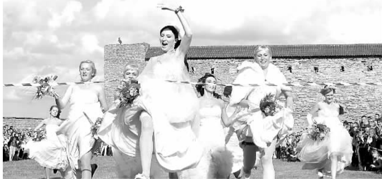
爱沙尼亚“新娘”赛跑 6月9日,在爱沙尼亚纳尔瓦的古城堡,身穿婚纱的“新娘”在这里参加赛跑。

定的环境,孩子们很容易融入,此外,卫生条件好,孩子不容易受到传染病的侵袭。根据澳有关规定,从事家庭日托的教育者需要获得儿童服务三级证书,这与其他提供儿童早期教育和看护机构工作人员的资质是一样的。同时,家庭日托教育者也需要注册登记,并接受联邦和地方管理机构的认定和管理。每个家庭日托机构同时接受的儿童人数不得超过5人。诺姆表示,限制家庭日托儿童数量意味着孩子们可以接受更加周全的照顾,看护人员可以与孩子们建立更亲密的关系,这对儿童早期的学习能力和社会发展能力都很关键。澳消费者权益保护组织的调查显示,家长们对家庭日托的服务满意度比常规的幼托中心高25%。(本报堪培拉6月10日电)