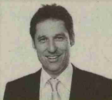
Urs Wiedmer Arena